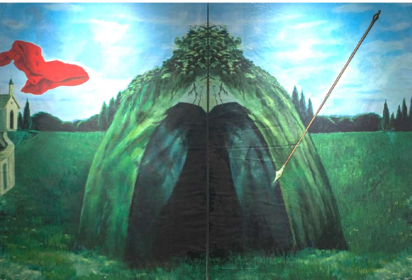
El ángel nunca sobrevuela el campo de batalla, 2015/25 Pintura sobre impresión en lona de vinilo – Díptico 196 x 146 x 5 cm c/u - Inventario Sur 25063RT