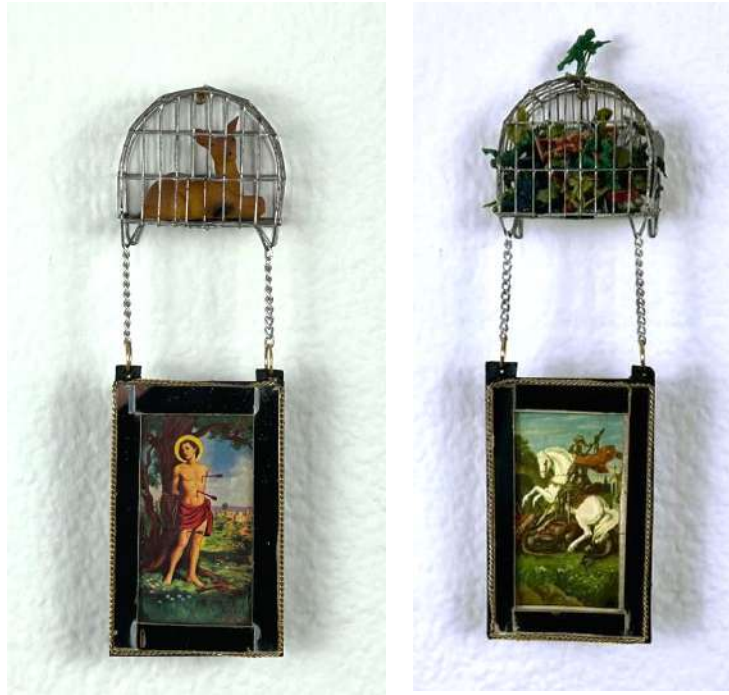
Atribuidos, 1995. Objetos miniaturas y folletos de oración 25 x 7x 4 cm c/u - Inventario Sur 25069RT; 25070RT

Esta serie fue exhibida por primera vez en Brasil en el año de 1995, en la exposición “Deseo para locos”. Pequeños objetos creados a partir de fragmentos de memoria de un mundo interior que se revienta. La dicotomía entre fragilidad y fuerza, rendición y resistencia.