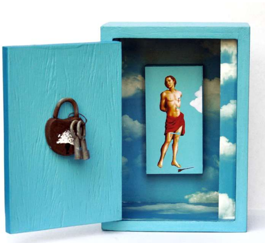
Cuanto más humanos somos... más divinos seremos, 1994 Objetos oratorios / madera 19 x 14 x 8,5 cm c/u - Inventario Sur 25057RT; 25054RT; 25053RT