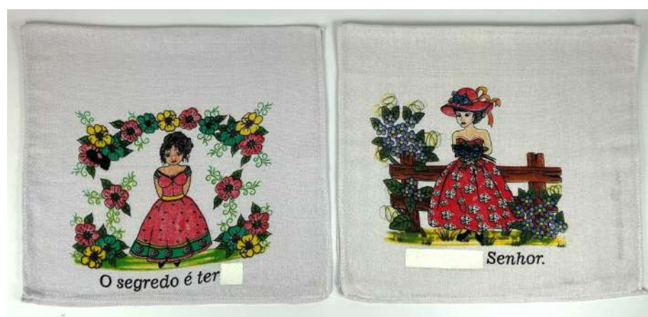
Sanaciones y angustias, 2024. Pintura sobre impresión en tela de algodón 40 x 88 cm cada díptico. Inventario Sur 24077RT; 24076RT; 24078RT