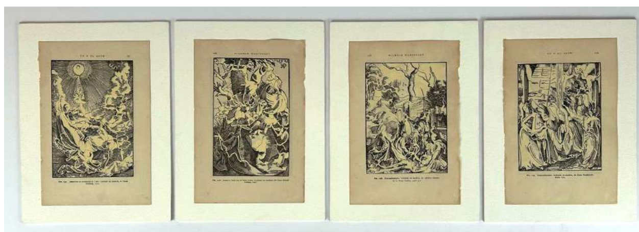
Demasiados orgánicos, 2021. Intervención sobre impresión 14 x 10,5 cm c/u - Inventario Sur 25074RT

El blanco y negro tan habitual en los tradicionales grabados clásicos e impresos de libros antiguos, funciona como fondo para nuevas composiciones en las que Rosindo Torres utiliza pintura blanca (liquid paper) para borrar lo superfluo de la imagen y destacar la esencia de las formas que le interesa mantener.