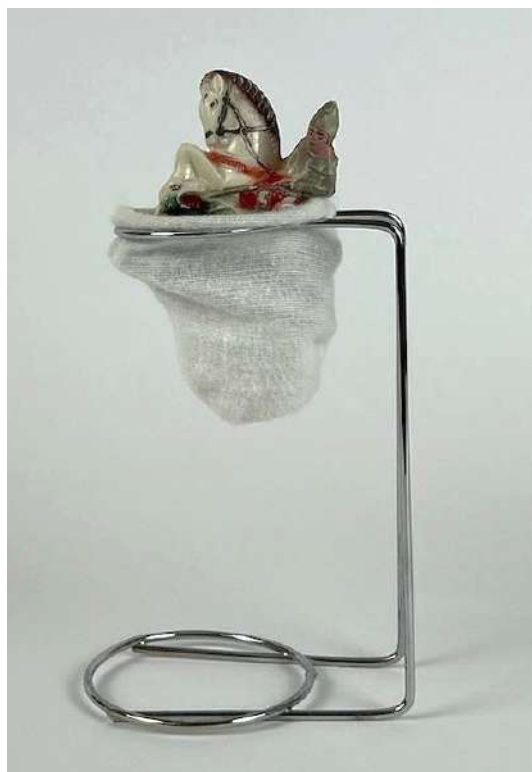
Sin los títulos, 2024. Objeto Figura de plástico PVC, soporte de metal y colador de tela 20 x 8 x 10 cm c/u - Inventario Sur 25044RT; 25045RT

Simbólicamente, San Antonio es el realizador de pedidos de los enamorados en Brasil. Esta creencia está arraigada en la cultura popular brasileña, tal cual la tradición del café artesanal. El colador de tela de algodón es una reverencia a las abuelitas y a la preservación de hábitos que se quedan grabados en el sensorial. Para la exposición Entre lo sagrado , el artista presenta esta memoria de las tradiciones de su infancia, y añade la figura de San Jorge, considerado el santo de los enamorados en Cataluña.