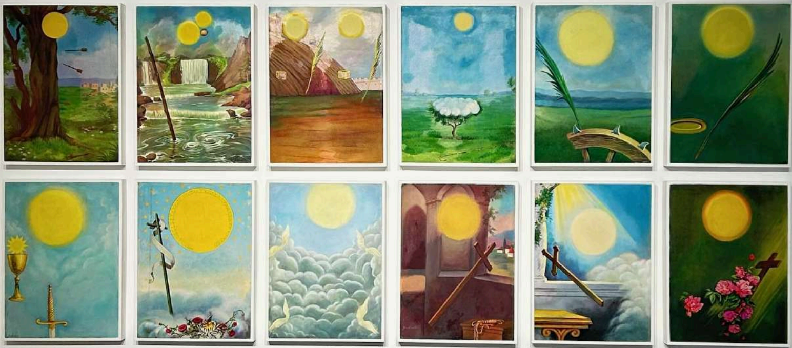
Atributos para jóvenes rebeldes, 2019/20 Pintura sobre impresión (veladura) 39,5 x 29,5 x 4 cm c/u - Inventario Sur 25075RT

Al borrar la imagen encarnada de los santos, Rosindo Torres obliga al observador a examinar con atención los atributos de la iconografía cristiana. El santo ausente asume una condición fantasmal en la pintura, una ausencia que se transforma en una presencia velada.