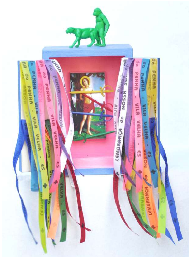
Cuanto más humanos somos... más divinos seremos, 1994 Objetos oratorios / madera 19 x 14 x 8,5 cm c/u - Inventario Sur 25052RT; 25055RT; 25056RT