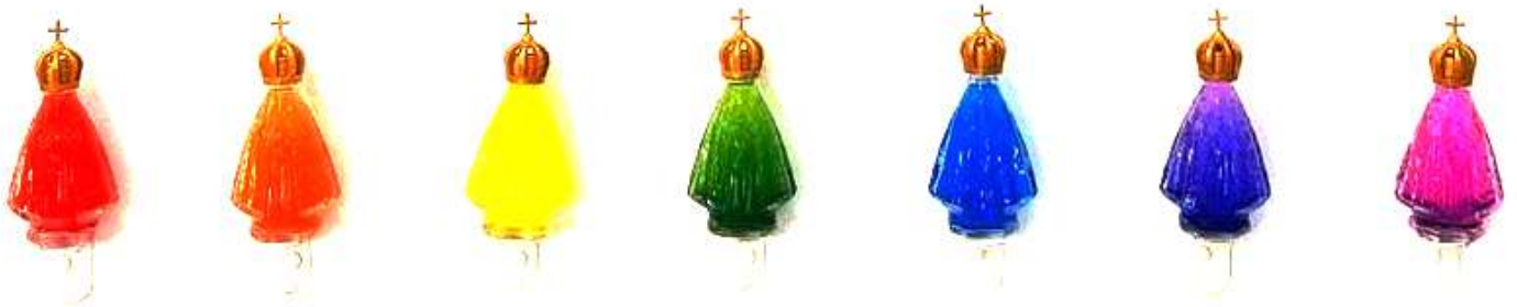
Devociones seculares, 2024 Objeto / vidrio, plástico y pintura al agua 77 x 5 x 2 cm - Inventario Sur 25041RT

En un gesto simbólico, Rosindo Torres deposita la visibilidad de la pauta LGBTQIA+ en siete delicadas botellitas de vidrios con el formato de la Virgen Patrona de Brasil, Nuestra Señora de Aparecida.