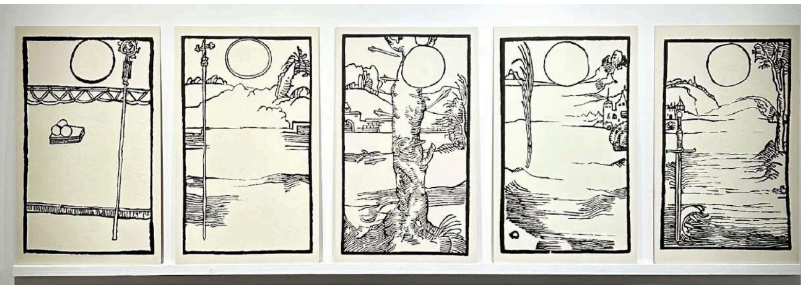
Avatar, 2018/20. Intervención sobre impresión (veladura) Soporte de madera 42 x 26 x 4,5 cm c/u - Inventario Sur 25073RT