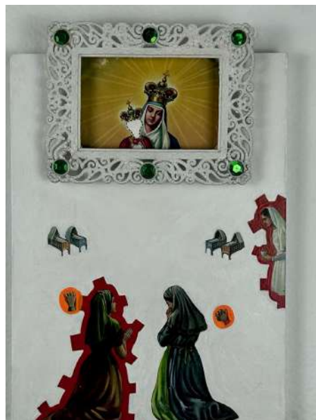
El testigo, 1998 Pintura y objetos sobre imaginería popular (reproducción impresa) 40 x 28 x 4,5cm Inventario Sur 25065RT

Arrodillarse forma parte de la liturgia cristiana y es un movimiento corporal asociado a la humildad. El artista elige trabajar imágenes de la iconografía femenina utilizando el collage y assemblage de objetos ordinarios para reinventar narrativas misteriosas y complejas. El título de la serie tiene un toque de parodia porque en 1998 se estrenó una telenovela brasileña en la que la actriz Glória Pires interpretó a la ambiciosa villana Maria de Fátima, personaje aún hoy recordado por sus niveles de crueldad y manipulación a lo largo de la trama.