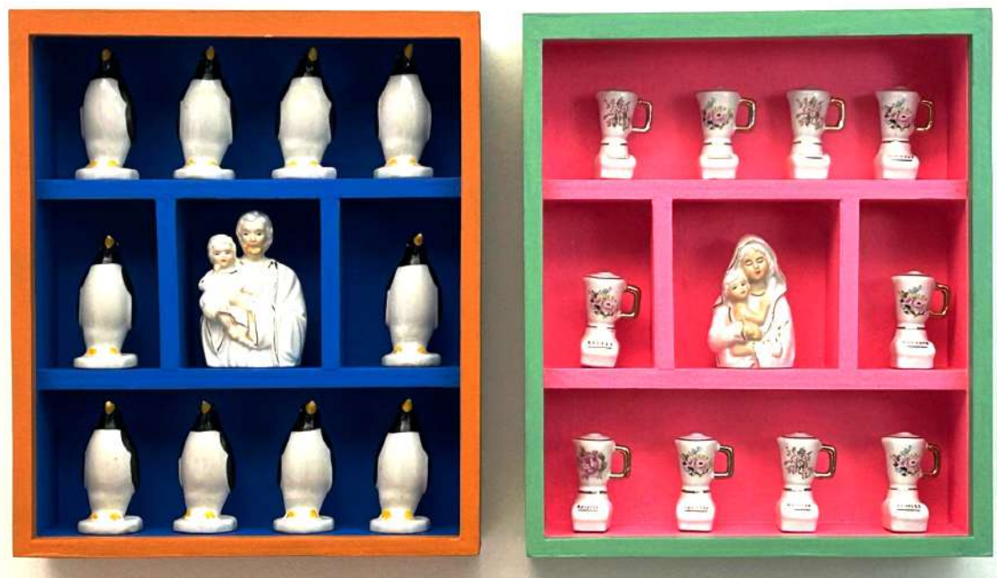
Cubre tu pie tanto como lo permita la manta, 1996. Objeto/ Estantería con miniaturas Duerme con ese ruido, 1996. Objeto/ Estantería con miniaturas 30 x 25 x 7,5 cm c/u - Inventario Sur 25047RT, 25046RT

Para esta muestra panorámica de la trayectoria del artista Rosindo Torres la selección comienza por obras que se exhibieron por primera vez en Brasil en la década de 1990. Son piezas tridimensionales de pequeño formato y estética kitsch , que funcionan como interrogantes de imágenes cansadas y costumbres establecidas.