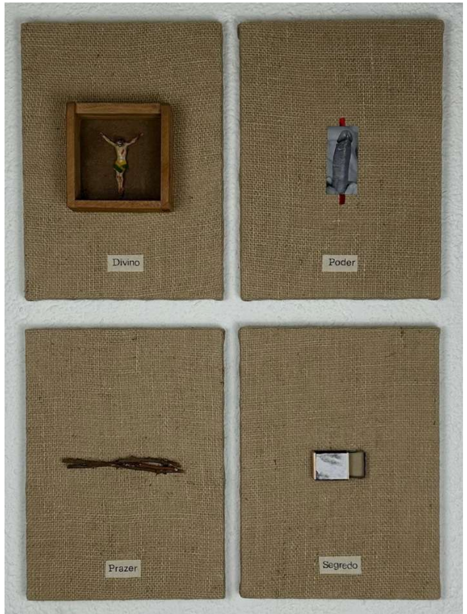
Sin los títulos, 1992. Arpillera, objetos y palabras impresas. 27 x 36 x 2 cm cada díptico Inventario Sur 24071RT; 24072RT

La asociación de ciertas palabras e imágenes puede provocar incomodidad, inquietud o controversia. Quizás por eso se vetó la participación de estos dípticos en una exposición institucional en Brasil en 1992. La obra permaneció oculta durante 34 años y ahora luce como la pieza inédita más antigua en la Galería Sur.