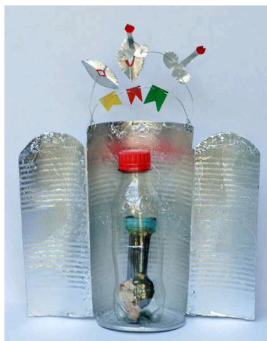
Lánguidos lenguajes, 1998. Objeto / Aluminio, papel y plástico 30 x 22 x 10 cm c/u - Inventario Sur 25048 RT; 25049RT; 25059RT; 25051RT

Hay muchas maneras de conectar con lo sagrado. San Antonio es uno de los santos cristianos más populares de Brasil, y su festividad se celebra en junio con banderas coloridas, música y comidas típicas. Considerado el santo del amor, en varios países latinoamericanos, cuando una persona soltera le pide pareja, coloca una imagen suya boca abajo o la sumerge en una botella, y la pone boca arriba cuando su deseo se cumple.