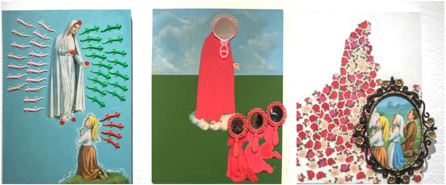
¿Qué dice María de Fátima? 1998. Pintura y objetos sobre imaginería popular (reproducción impresa) 38 x 28 2,5 cm c/u - Inventario Sur 25066RT; 25067RT; 25068RT