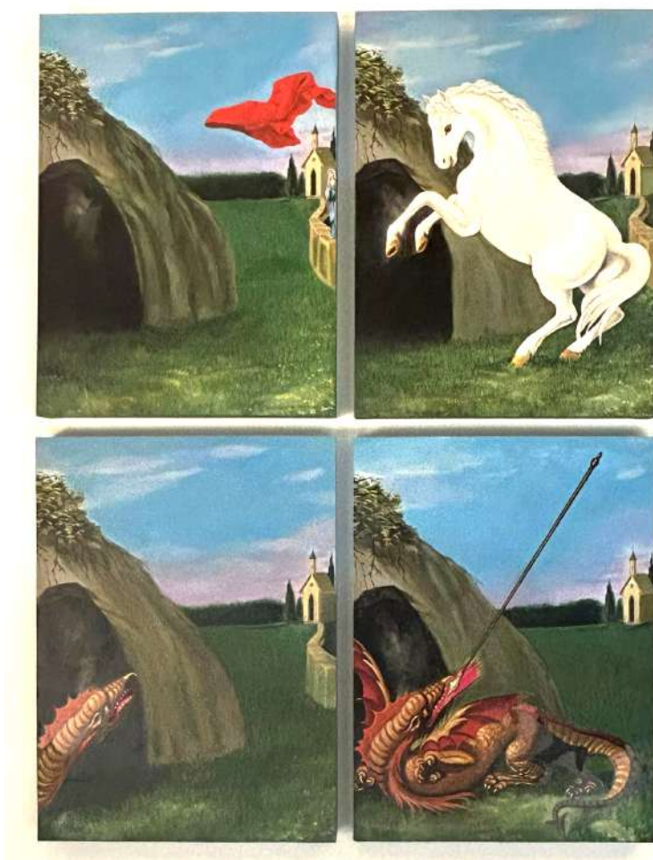
Atributos para un joven guerrero, 2024. Pintura (intervención sobre póster popular) 38 x 28,5 x 2,5 cm c/u- Inventario Sur 25064RT

La creación de pinturas y objetos a partir de apropiación, intervención y ensamblaje evidencia la crítica social de las relaciones de poder. En las obras de Rosindo Torres los fragmentos de memoria dialogan con elementos que transitan entre el universo cristiano y la herencia religiosa afrobrasileña, en un juego con muchas capas de sentido más allá de las apariencias.