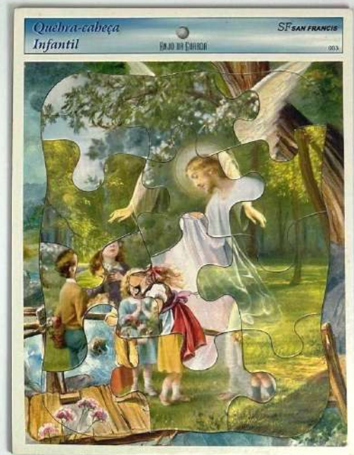
Catequesis, 2020 Rompecabezas de cartón 29 x 22, 5 cm - Inventario Sur 25079RT

Los habituales rompecabezas mecánicos son poderosos soportes de imágenes. El artista juega con el mensaje de que no todas las narrativas encajan tan bien como parece, a veces las circunstancias nos obligan a lidiar con distorsiones o fragmentos sin sentido.