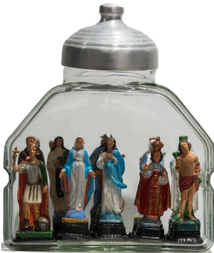
Inviolables, 2024 Objeto / vidrio y plástico 27 x 22 x 15 cm Inventario Sur 24042RT

En un gesto simbólico, Rosindo Torres deposita la visibilidad de la pauta LGBTQIA+ en siete delicadas botellitas de vidrios con el formato de la Virgen Patrona de Brasil, Nuestra Señora de Aparecida.