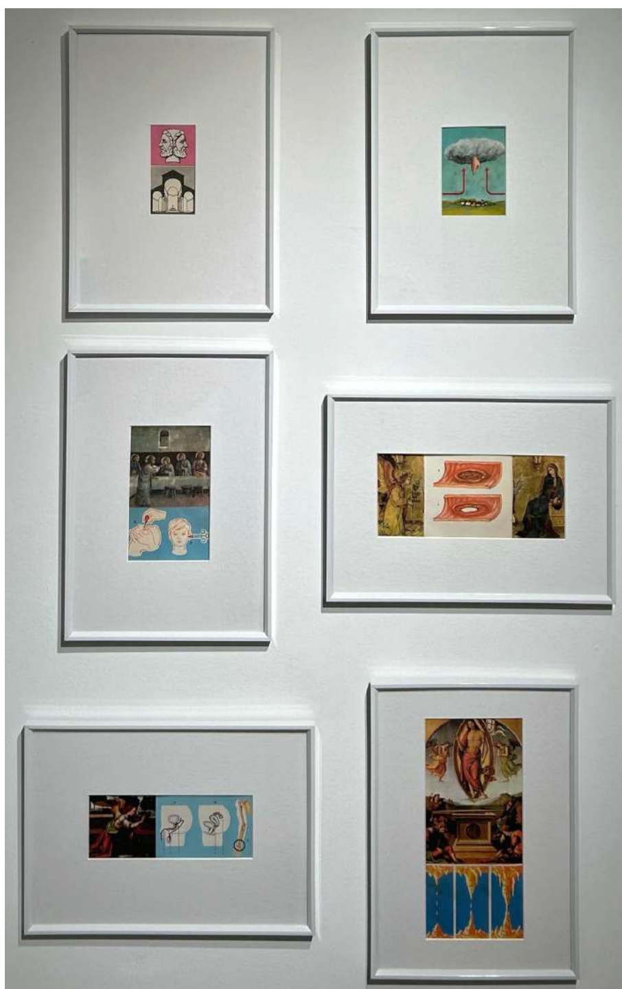
Serie Enciclopedia de la vida maravillosa, 2020. Collage analógico. 29 x 21 cm c/u Inventario Sur 24080RT; 24081RT; 24059RT; 24062RT; 24061RT; 24060RT

Durante la pandemia, Rosindo Torres descubrió una enciclopedia ilustrada de conocimiento general titulada La vida maravillosa . Codiciada en la década de 1970, la publicación está repleta de viejas imágenes de teorías obsoletas o refutadas. En manos del artista, este rico contenido se convierte en materia prima para diálogos visuales en divertidas combinaciones de collages.